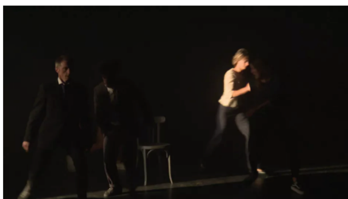
Le spectacle "Ombre Portées" de la compagnie l'Oubliée. (FRANCEINFO)